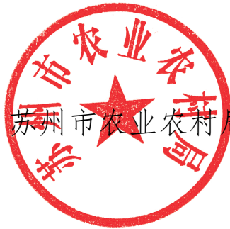
苏州市农业农村局