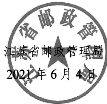
江苏省邮政管理局 2021年6月4日