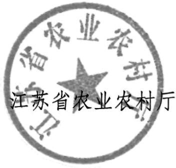
江苏省农业农村厅